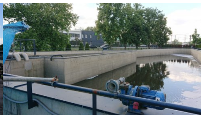
zbiornik retencyjny wód opadowych i ścieków pożarniczych