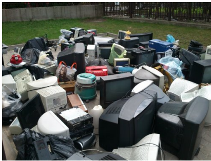
Zbiórka w Gimnazjum Miejskim Nr 3 w Mińsku Mazowieckim w dniu 27 kwietnia 2013r. (3)