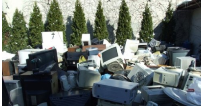
Zbiórka odpadów na terenie Szkół Salezjańskich w Mińsku Mazowieckim w dniach 22 i 23 marca 2013r.

wymagało zadanie polegające na zorganizowaniu zbiórki zużytego sprzętu elektrycznego i elektronicznego na terenie szkoły.