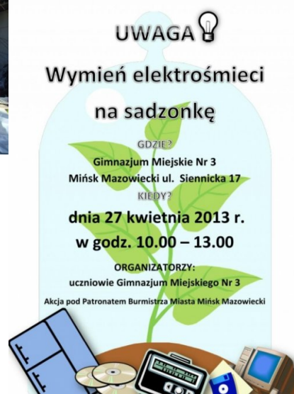
Zbiórka w Gimnazjum Miejskim Nr 3 w Mińsku Mazowieckim w dniu 27 kwietnia 2013r. (1)