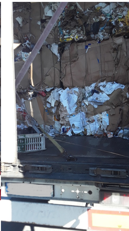
Kontrola drogowa pojazdów przewożących odpady przy drodze krajowej nr 60