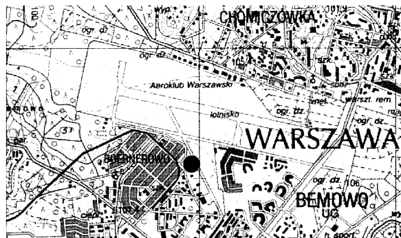
Rys. 2. Lokalizacja PP. 2.