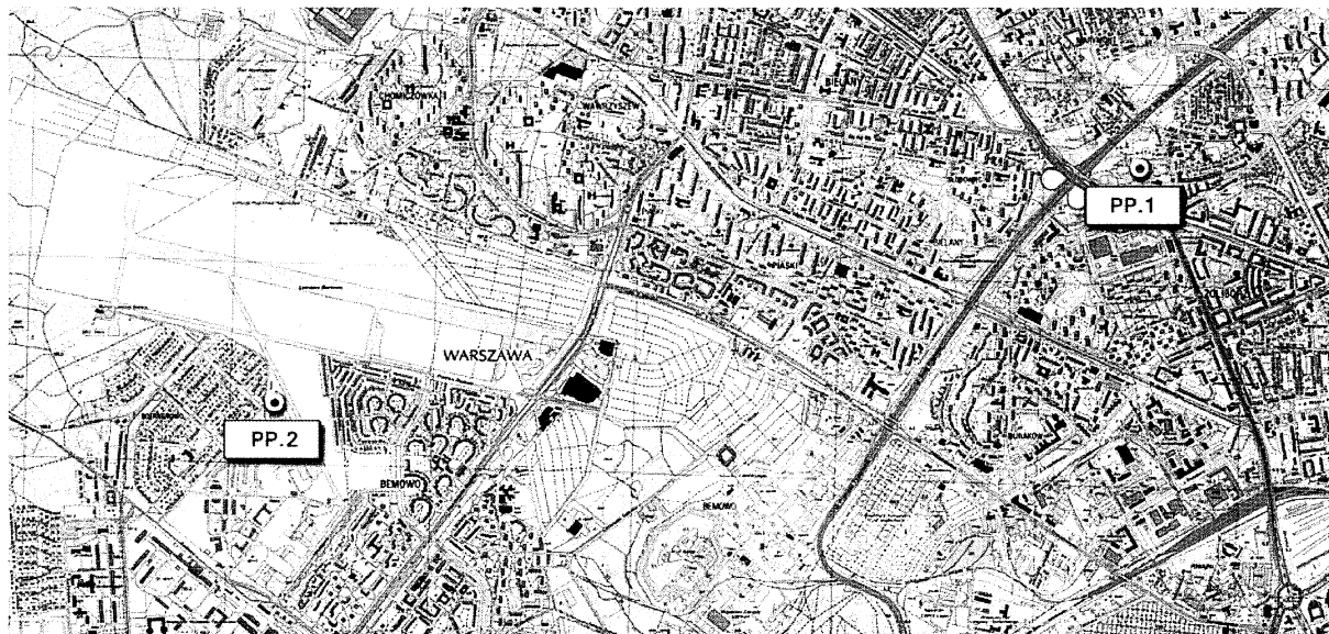
Rys. 3. Lokalizacja punktów pomiarowych PP.1 i PP.2