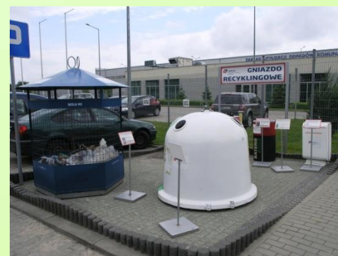
PSZOK w Radomiu