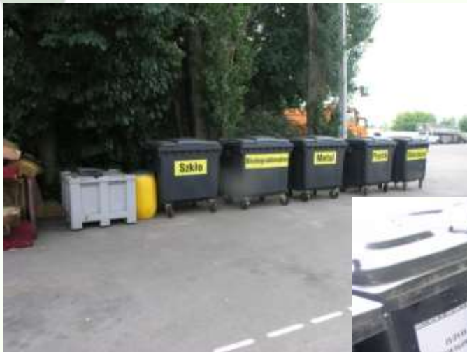
PSZOK w Mławie